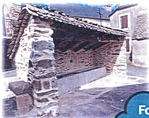
Fontaine du Villaret